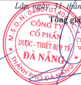
TỔNG VIẾT PHẢI