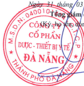
TÓNG VIỆT PHẢI