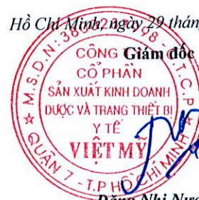
Đặng Nhị Nương