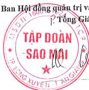
TRƯƠNG VINH THÀNH