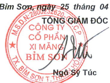
Ngô Sỹ Túc