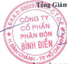
LÊ QUỐC PHONG