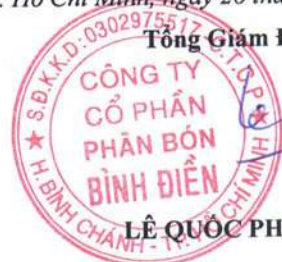
LÊ QUỐC PHONG