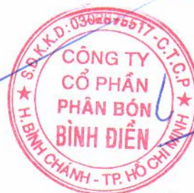
LÊ QUỐC PHONG