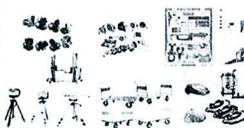
Một số ngành hàng kinh doanh tiêu biểu