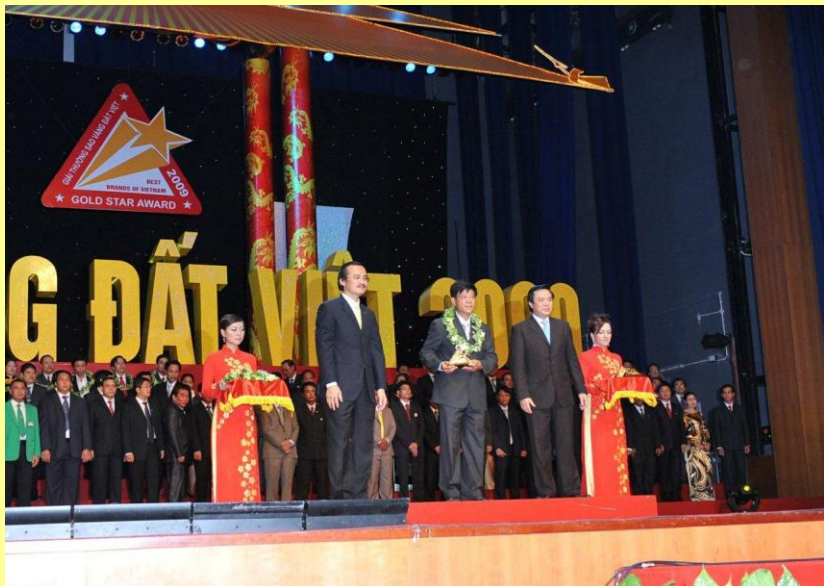
(Lãnh đạo công ty nhận giải thưởng Sao vàng đất Việt lần thứ 2)