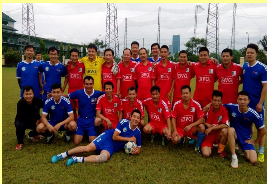
(Công nhân lao động của công ty cùng ban lãnh đạo giao lưu bóng đá năm 2015)