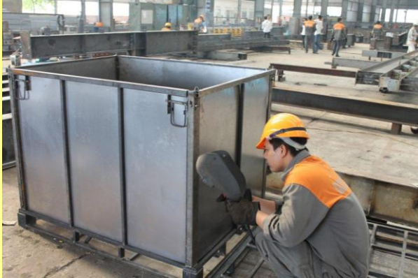
Thùng đựng hàng Smart I – tainer phục vụ ngành công nghiệp Logistics