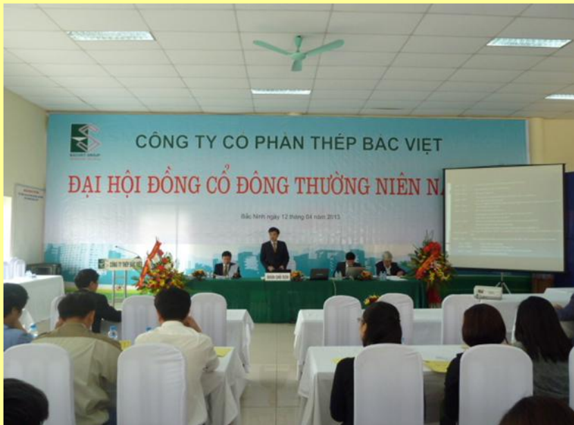
(Đại hội cổ đông thường niên 2015 tổ chức 12/4/2015 tại công ty)

Năm 2015 Công ty đã tiếp tục trải qua một năm đầy khó khăn trong lĩnh vực kinh doanh liên quan đến hoạt động gia công cơ khí do giá nguyên liệu đầu vào liên tục giảm sâu và các khoản chi phí tài chính còn cao khiến cho Công ty không hoàn thành được các chỉ tiêu mà Đại Hội Đồng cổ đông 2015 đã giao. Tuy nhiên trong năm qua, Công ty đã có những nỗ lực đạt được những chỉ tiêu về doanh thu, về lợi nhuận gộp và đặc biệt đã tập trung vào phát triển và xây dựng Công ty Cổ phần Công Nghệ Bắc Việt (công ty con) trở thành nhà cung cấp khuôn mẫu và gia công nhựa hàng đầu. Đây là cơ sở để Công ty tái cấu trúc sản xuất và tập trung vào thay đổi ngành nghề chính của Công ty trong những năm tiếp theo. Bên cạnh đó Công ty cũng đã tập trung cơ cấu thu hồi được nhiều công nợ, và giảm dư nợ của ngân hàng xuống mức an toàn.