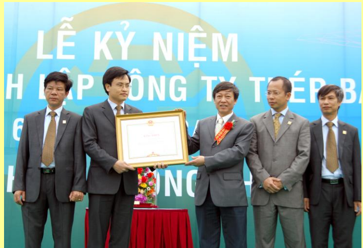
(Lãnh đạo công ty nhận bằng khen Thủ tướng)