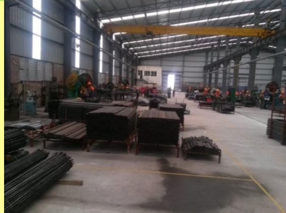
Sản xuất giàn giáo và cốt pha công nghệ Nhật bản với chất lượng rất cao