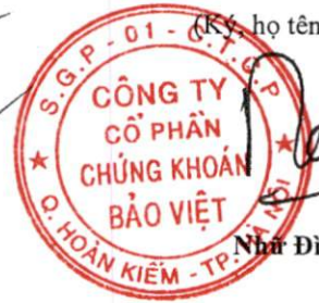
Nhà Đình Hòa