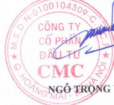
NGÔ TRỌNG VINH