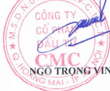
NGÔ TRỌNG VINH