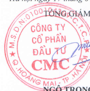
NGÔ TRỌNG VINH