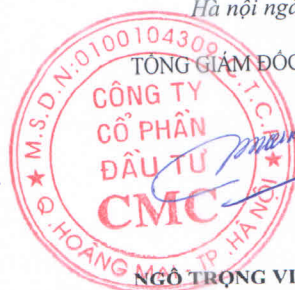
NGÔ TRỌNG VINH