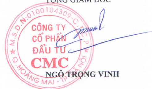
NGÔ TRỌNG VINH