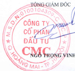
NGÔ TRỌNG VINH