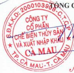
Nguyễn An Ninh