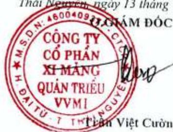
Trần Việt Cường