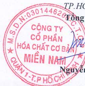
Nguyễn Hữu Thọ