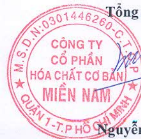
Nguyễn Hữu Thọ