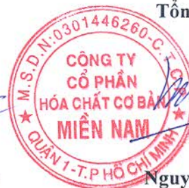
Nguyễn Hữu Thọ