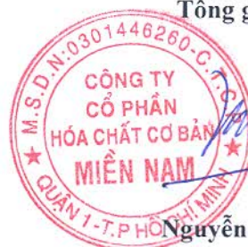
Nguyễn Hữu Thọ