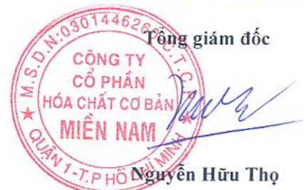
Nguyễn Hữu Thọ