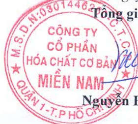
Nguyễn Hữu Thọ