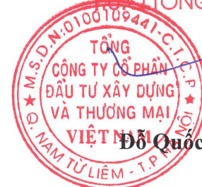
Đỗ Quốc Việt