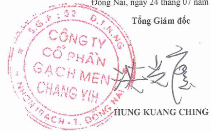
HUNG KUANG CHING