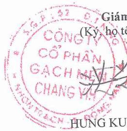
HUNG KUANG CHING