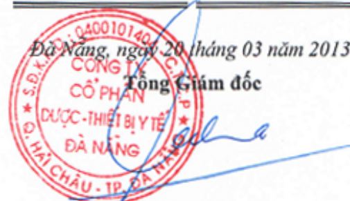
Tổng Giám đốc