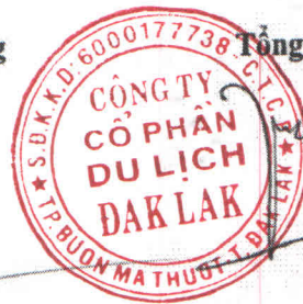
NGUYỄN THỊ SÁU