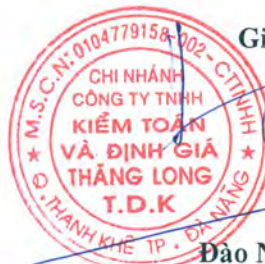
Đào Ngọc Hoàng

Giấy Chứng nhận hành nghề Kiểm toán Số: 0106 - 2014 - 045 - 1 Bộ Tài chính cấp ngày 22/08/2014