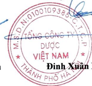
Đinh Xuân Hân