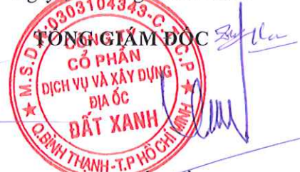
LƯƠNG TRÍ THÌN