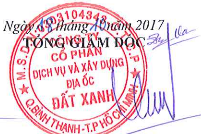
LƯƠNG TRÍ THÌN