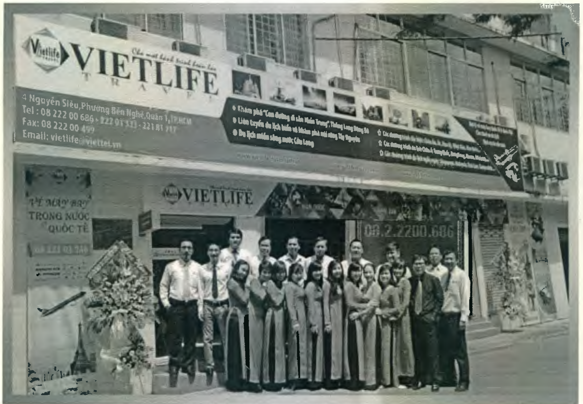
Hình ảnh cán bộ nhân viên của VietLife

Bằng kinh nghiệm, sự tận tâm và những nỗ lực hoàn thiện không ngừng của tập thể CBNV, Vietlife Travel tự tin trở thành nhà tổ chức chuyên nghiệp các loại hình du lịch: từ du lịch nghỉ dưỡng, du lịch sinh thái, du lịch kết hợp khảo sát hay hội nghị... cho nhiều đối tượng khách hàng khác nhau. Với tiêu chí chăm sóc khách hàng: tận tâm đến từng cá nhân, chu đáo với mỗi gia đình, đồng hành cùng các cơ quan, đơn vị, các tổ chức, đoàn thể... thương hiệu Vietlife Travel ngày càng vững mạnh trên thị trường du lịch, mang lại những dịch vụ chất lượng cao, giá cả phải chăng phục vụ quý khách hàng gần xa.