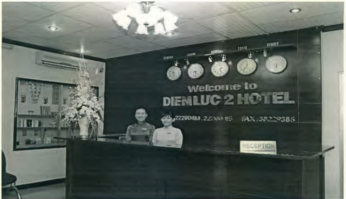
Hình ảnh khách sạn điện lực 2

Tọa lạc tại vị trí đắc địa của thành phố Hồ Chí Minh, cách nhà hát thành phố chỉ 500m, rất gần các điểm du lịch nổi tiếng như Dinh Thống Nhất, Chợ Bến Thành, Nhà thờ Đức Bà, Bảo tàng,... Khách sạn du lịch Điện lực với sức chứa 50 phòng đầy đủ tiện nghi, 10 phòng loại cao cấp cung cấp đầy đủ các dịch vụ thiết yếu cho du khách lưu trú như nhà hàng, thuê xe du lịch,... sẵn sàng đáp ứng mọi nhu cầu của các đoàn khách hoặc khách lẻ.