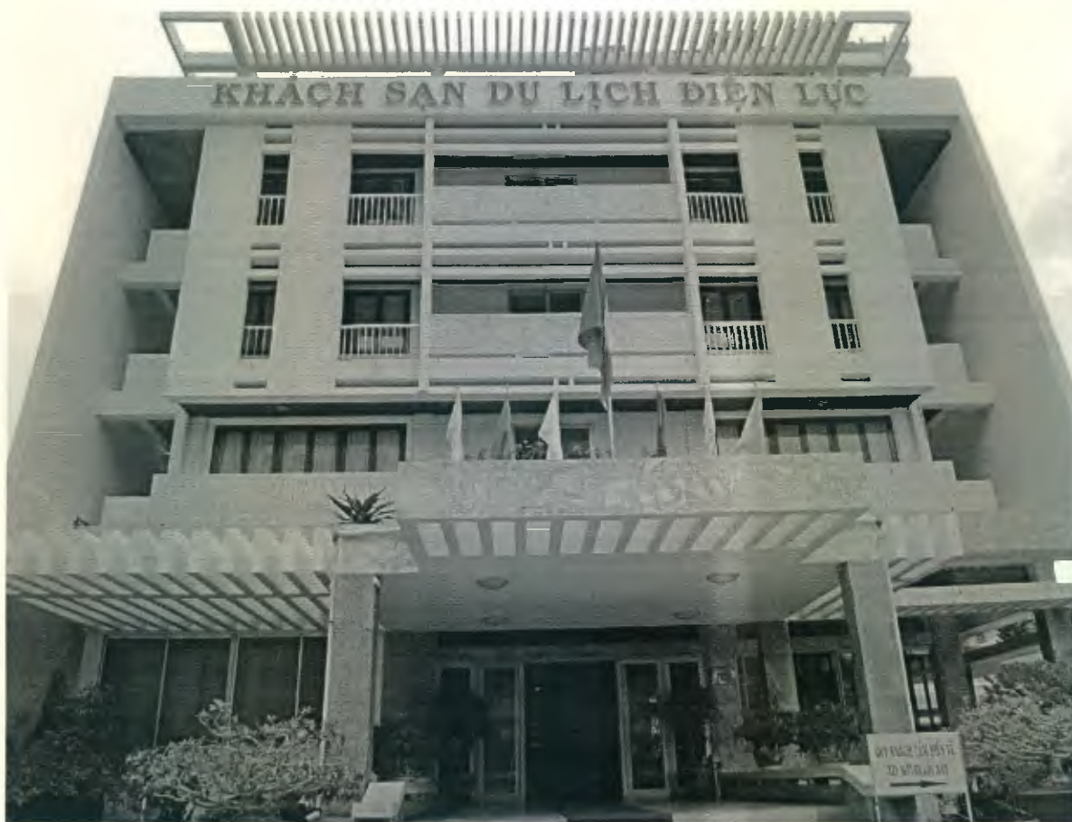
Hình ảnh Khách sạn Du lịch Điện lực Vũng Tàu

Khách sạn Du lịch Điện lực Vũng Tàu được đi vào hoạt động từ khá sớm, từ năm 1992. Qua hơn 20 năm hình thành và phát triển, Khách sạn đã không ngừng đổi mới trang thiết bị cũng như phong cách phục vụ, cùng với hệ thống trang thiết bị hiện đại và phong cách phục vụ chuyên nghiệp. Khách sạn Du lịch Điện lực Vũng Tàu đạt tiêu chuẩn 2 sao, có tổng số 80 phòng (sức chứa 240 khách) được trang bị đầy đủ tiện nghi và dịch vụ. Tất cả các phòng ngủ đều được thiết kế trang nhã không chỉ mang tính thẩm mỹ mà còn đem đến sự ấm cúng và thoải mái, nhằm đáp ứng nhu cầu nghỉ ngơi và thư giãn của khách du lịch cả trong nước và ngoài nước. Phòng ngủ có diện tích rộng, được bố trí các loại giường đôi, giường đơn, phòng gia đình, phòng tập thể... Khách sạn nằm cạnh bãi tắm Thùy Vân, dưới chân núi Nghinh Phong, nơi có tượng chúa Giesu – một thắng cảnh tuyệt vời và nổi tiếng của thành phố biển Vũng Tàu.