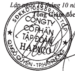
Vũ Xuân Cường