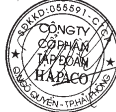
Vũ Xuân Cường