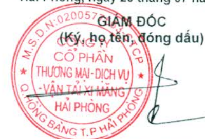
Khoa Năng Tuyên