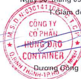
Đương Công Phùng