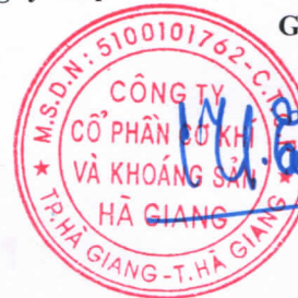
Đỗ Khắc Hùng