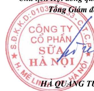
HÀ QUANG TUẤN