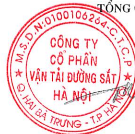
Trần Thế Hùng