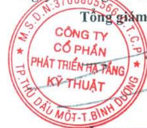
ĐỖ QUANG NGÔN