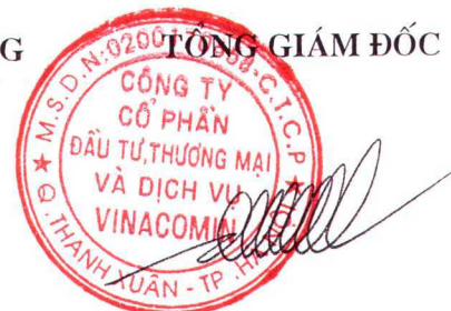
Thiều Quang Thảo