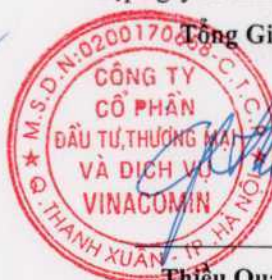
Thiều Quang Thảo