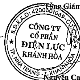
Nguyễn Cao Kỳ

Các thuyết minh từ trang 8 đến trang 34 là một bộ phận hợp thành của báo cáo tài chính hợp nhất