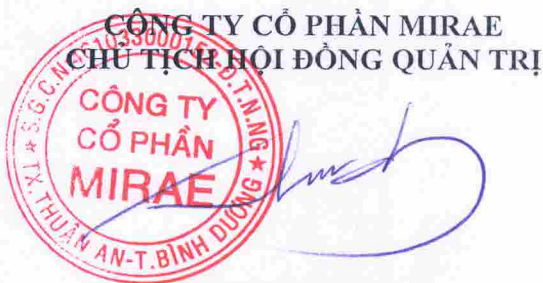
SHIN YOUNG SIK