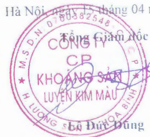
Trần Kiên Cường