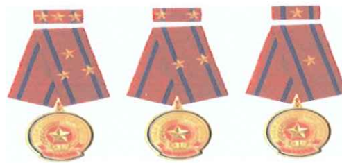
Huân chương lao động hạng nhất, nhì, ba

Qua hơn 35 năm xây dựng và phát triển, Công ty đã có những đóng góp cho sự phát triển của đất nước và đã được Nhà nước trao tặng Huân chương Lao động hạng Nhất, Nhì và Ba.