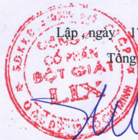
Cao Thành Tín