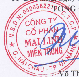
Võ Thành Nhân