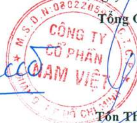
Tôn Thất Mạnh