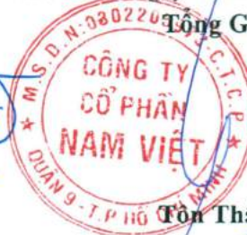
Tôn Thất Mạnh