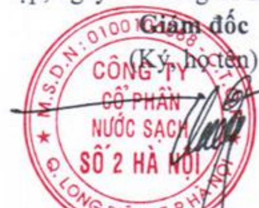
Nguyễn Hữu Thắng