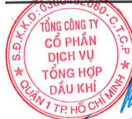
Phùng Tuấn Hà Chủ tịch HĐQT

Các thuyết minh từ trang 6 đến trang 21 là một bộ phận một hợp thành của báo cáo tài chính hợp nhất