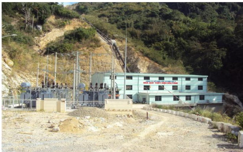
Toàn c nh Nhà máy thủy i n k Pône

+ Ngày 01/06/2010: Nhà máy thủy i n (NMT ) k Pône chính th c a vào v n hành th ng m i.