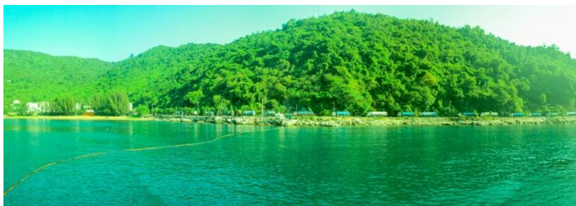
Xe bồn chờ nhận hàng tại Kho Xăng dầu Vũng Rô