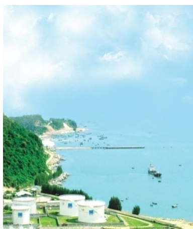
Hệ thống bồn chứa Kho Xăng dầu Vũng Rô