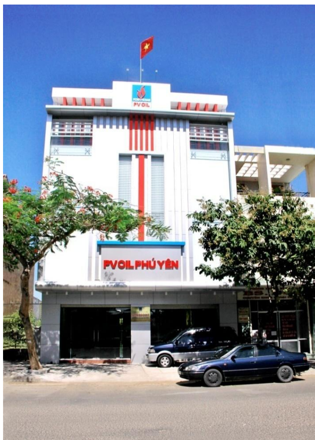
Văn phòng Công ty