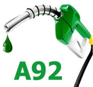
Xăng RON 92