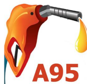
Xăng RON 95