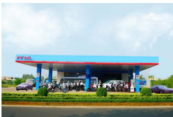
Cửa hàng xăng dầu Trung Tâm – 43 Nguyễn Tất Thành, TP Tuy Hòa, Tỉnh Phú Yên