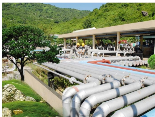
Hệ thống đường ống công nghệ Kho Xăng dầu Vũng Rô