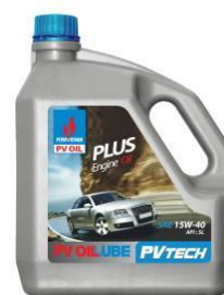
Dầu nhớt PV OIL LUBE