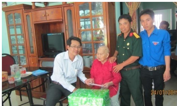
Thăm hỏi Mẹ Việt Nam Anh Hùng nhân ngày 27-7