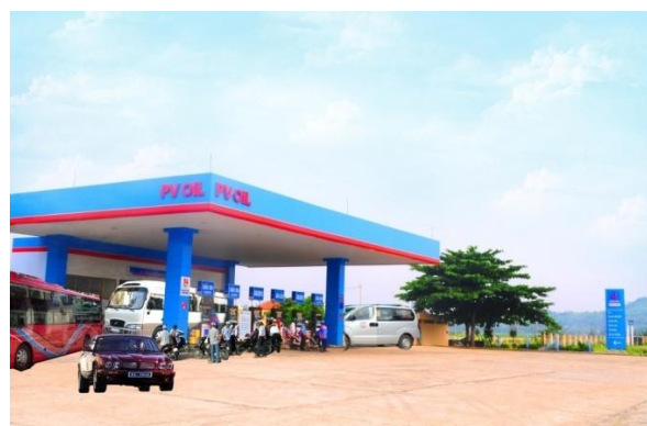
Cửa hàng xăng dầu Chí Thạnh, Quốc lộ 1A, Thị trấn Chí Thạnh, Huyện Tuy An, Tỉnh Phú Yên