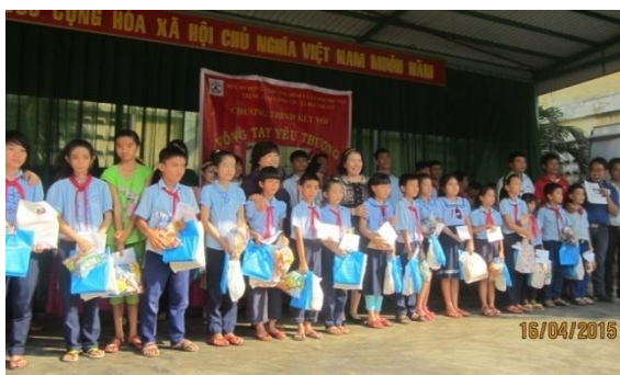
Tặng quà cho học sinh nghèo vượt khó

Vào các dịp khai trương cửa hàng mới, Công ty cũng dành tặng các sản phẩm để tri ân khách hàng. Ngoài ra, Công ty cũng thường xuyên tổ chức các hoạt động từ thiện xã hội, một cách nhằm khẳng định trách nhiệm của doanh nghiệp với cộng đồng.