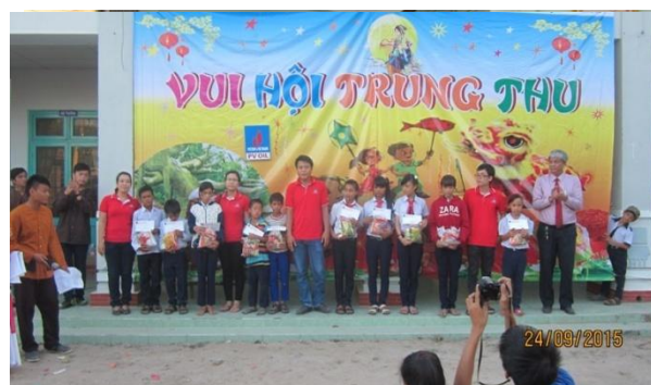
Tặng quà Tết Trung thu cho các cháu thiếu nhi xã Krông Pa, huyện Sơn Hòa