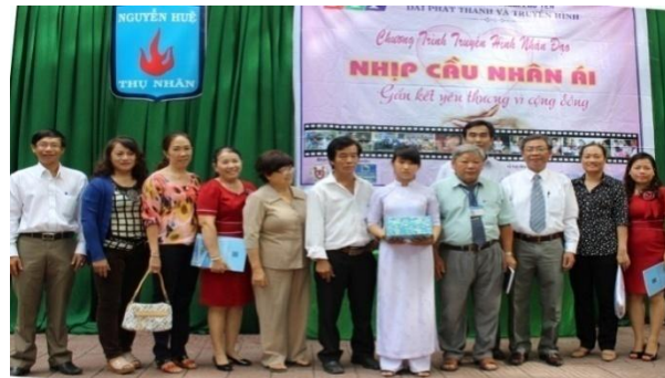
Tham gia, tài trợ chương trình “Nhịp cầu nhân ái” của Đài Phát thanh và Truyền hình tỉnh Phú Yên