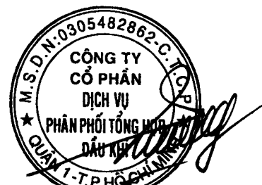
Vũ Tiên Dương Chủ tịch hội đồng quản trị