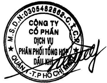
Vũ Tiên Dương Chủ tịch hội đồng quản trị