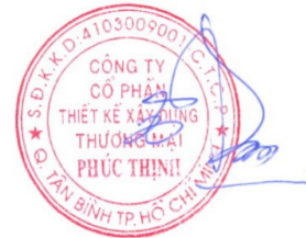
Tô Khải Đạt