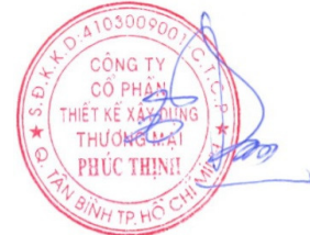
Tô Khải Đạt