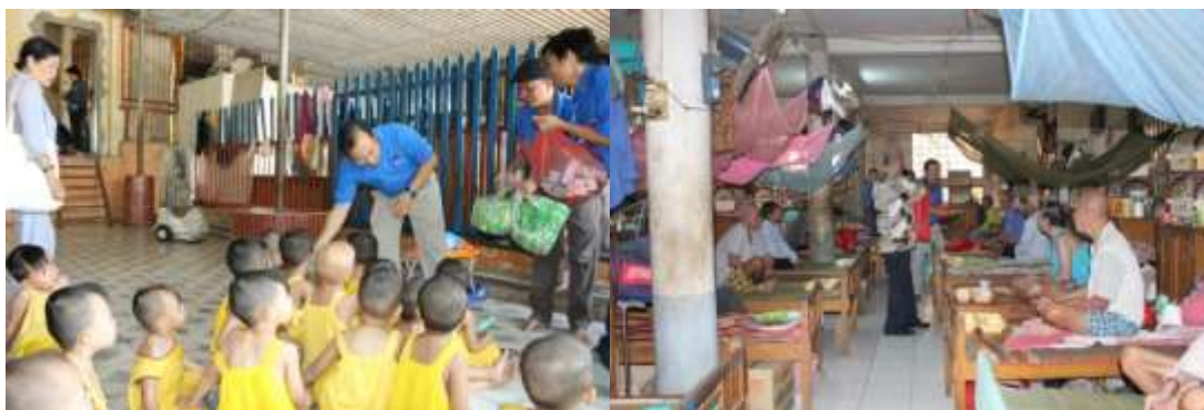
Thăm nơi nuôi dưỡng người già, trẻ em bị bỏ rơi tại Chùa Cẩm Phong - Tây Ninh

Năm 2014 Công đoàn Công ty đã tổ chức quyên góp được 50.000.000 đồng để ủng hộ cho Chùa Cẩm Phong - Tây Ninh nuôi dưỡng người già trẻ em bị bỏ rơi, không nơi nương tựa.