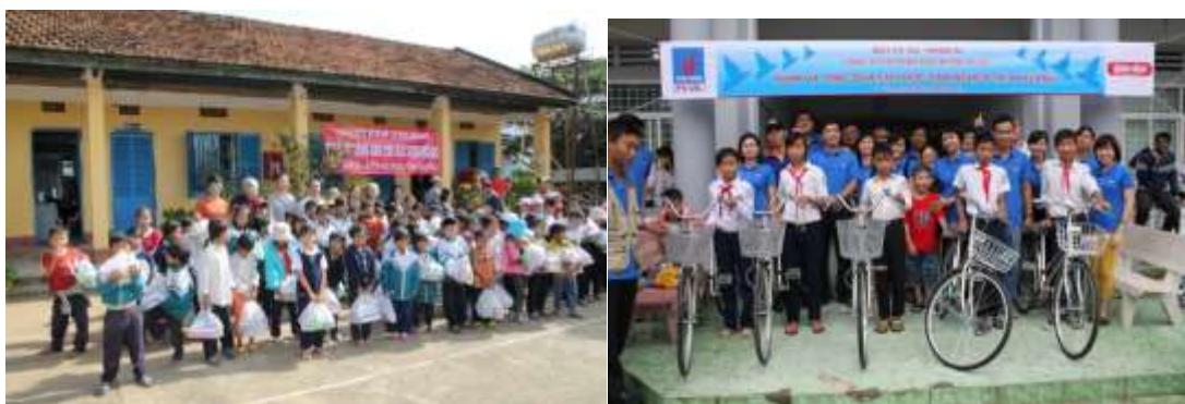
Tặng quà cho học sinh nghèo tại Lâm Đồng và An Giang

Năm 2013 Công đoàn Công ty đã tổ chức quyên góp được 80.000.000 đồng để ủng hộ Chùa Cẩm Phong – Tây Ninh nuôi trẻ mồ côi, người già neo đơn, hỗ trợ cho học sinh nghèo tại 02 huyện Tri Tôn và huyện Tịnh Biên, tỉnh An Giang, tặng 400 phần quà cho học sinh nghèo, người dân tộc ở huyện Đức Trọng tỉnh Lâm Đồng;