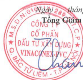
Vũ Thành Kiên