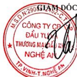
Đường Hùng Cường