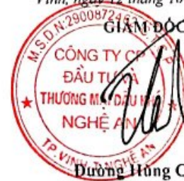
Đương Hùng Cường